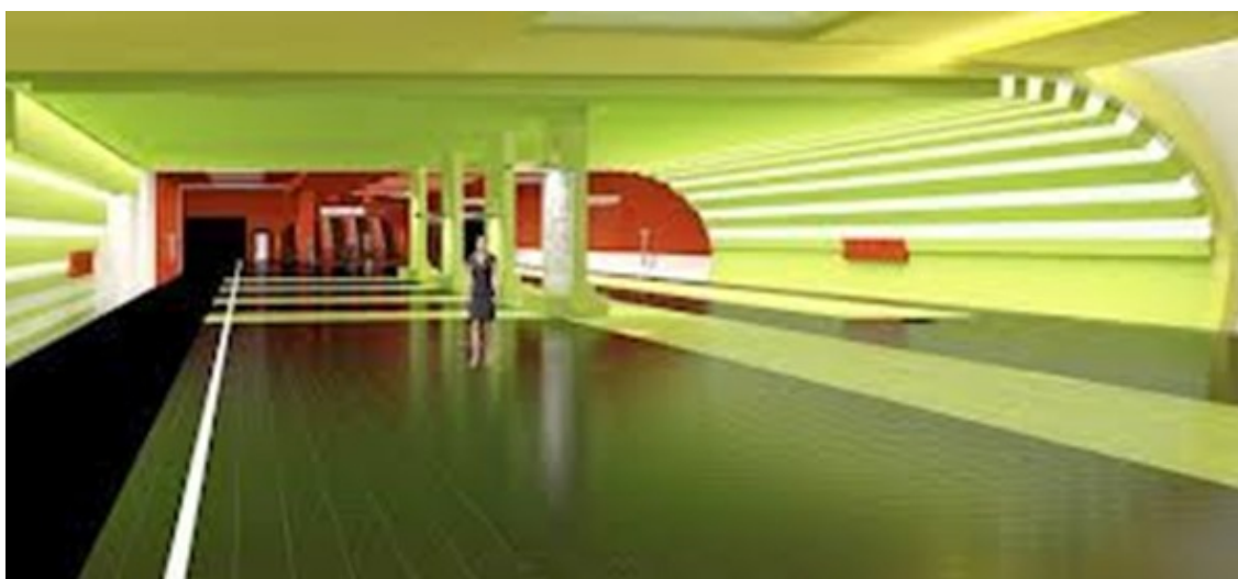
Пример макета 1