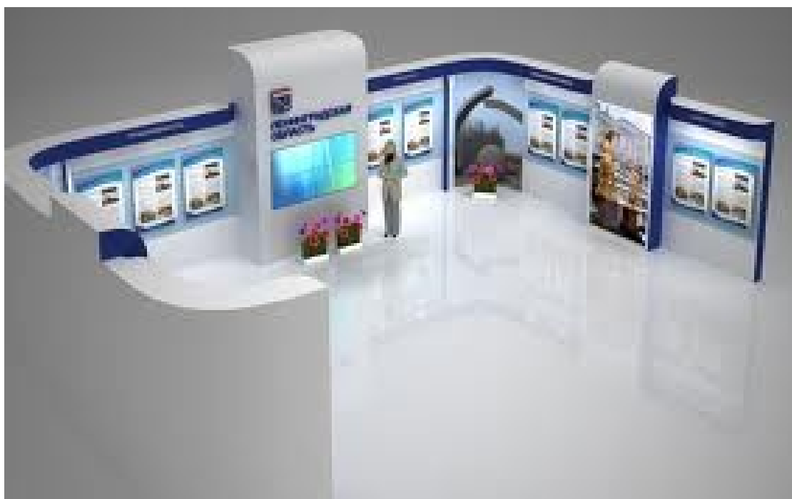
Пример макета 2